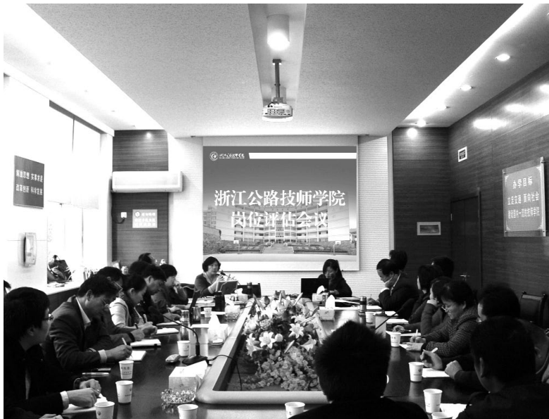
浙江公路技师学院开展人事管理改革

制度管理的最大优点就是决策有序——按照必要的程序在一定范围内集思广益后由最高管理者或决策机构拍板，执行到位——按照工作流程和工作标准规范地把事做到位，处理问题科学有据——充分展现管理者对教育规律和管理规律的把握运用，成效保证——系统的过程控制保证得到预期的结果。制度管理的成熟度主要取决于制度管理的系统化程度、过程控制的有效程度和基于事实的决策程度，也就是说制度管理是否形成一个完备的管理体系。只有当制度管理提升到体