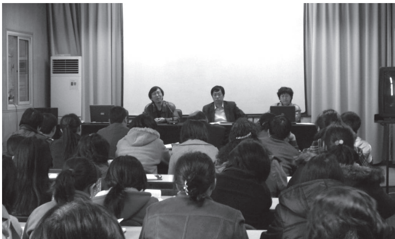
北京市应用高级技校启动校园文化和课程改革项目

管理模式的转型升级，一种情况是要打破自己已有的管理理念、行事准则、习惯方法，即使管理者本人有意为之，但惯性的力量往往也会把你拉回原来的轨道，这就需要管理者有清醒的自我认识和极强的管控能力；另一种情况是管理者要打破原有的管理模式，可能招致的非议、抵触和反对的力量有时也是非常强大的。即使你已决心改变，但仍然会有很多人不相信你