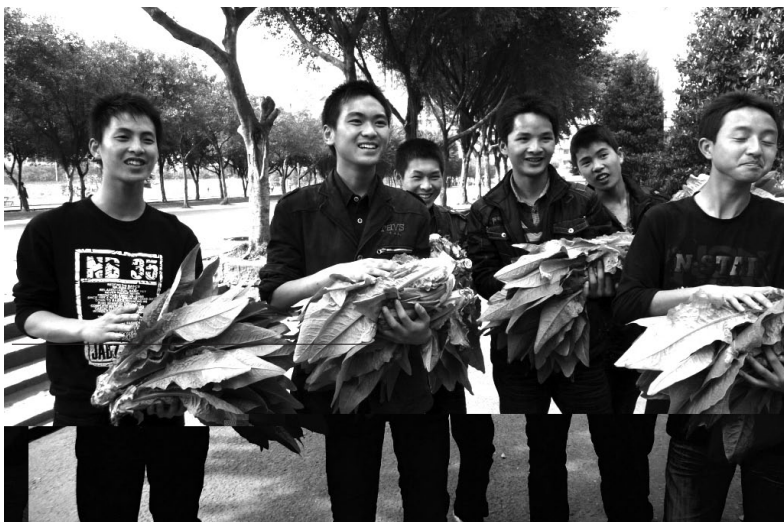
重庆行知技师学院学生在展示自己种的蔬菜